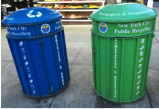
Figura 3. Programa de reciclagem da cidade de Nova York

Outro indicador importante na cidade de Nova York é a manutenção de espaços públicos como os parques municipais que pode ser visualizado a seguir.