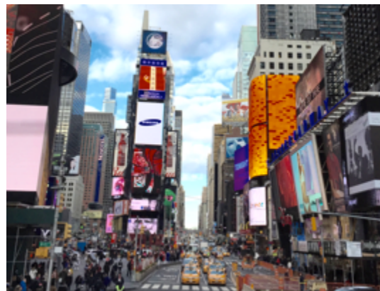
Figura 1. Times Square na cidade de Nova York

Algo que ilustra a permanente pujança econômica e a diversidade econômica na cidade de Nova York é o que se empreendido na ilha de Manhattan na área da Times Square e que pode ser visualizada na figura a seguir.