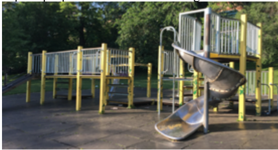
Figura 4. Morningside Park

Outro indicador importante na cidade de Nova York é a manutenção de espaços públicos como os parques municipais que pode ser visualizado a seguir.